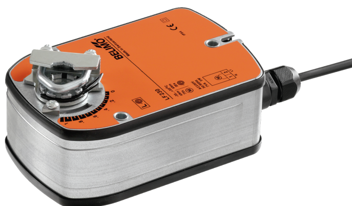
Billedet kan afvige fra produktet